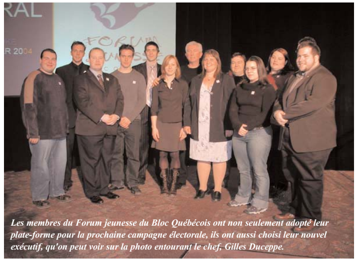
Les membres du Forum jeunesse du Bloc Québécois ont non seulement adopté leur plateforme pour la prochaine campagne électorale, ils ont aussi choisi leur nouvel exécutif, qu'on peut voir sur la photo entourant le chef, Gilles Duceppe.