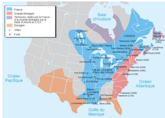
Carte de la Nouvelle-France vers 1750 1

L'Amérique française en 1759 ne se limite pas au Québec actuel. Elle s'étend du golfe Saint-Laurent au golfe du Mexique. Les treize colonies anglaises occupent une bande étroite entre l'Atlantique et les Appalaches. Au-delà de ces montagnes, le territoire français bloque leur expansion (voir la carte ci-dessous).