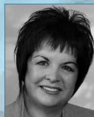
PAULE BRUNELLE, porte-parole en matière d'Industrie et députée de Trois-Rivières