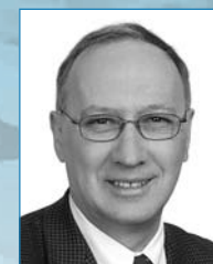
JEAN-YVES ROY, porte-parole en matière de Développement régional et député de Haute-Gaspésie—La Mitis—Matane—Matapédia